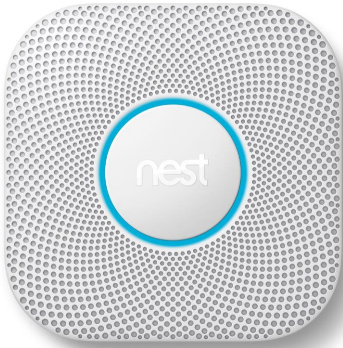
Pav. 2. Nest „Protect 2nd Gen Smoke + Carbon Monoxide Alarm“ dūmų detektorius

pateikus projektą, svarbu tik pradžiai išplėsti Skanseno apsaugos zoną ir įregistruoti į UNESCO "Šiaudinės" mikro-rajono geriausiai išlikusių pastatų teritoriją) istoriniam miesto rajonui. Viso reikėtų apie 300 \times 5 = 1500 dūmų detektorių. Teigti pirmenybė išmaniesiems detektoriams ("Smart home"), kurie būtų prijungti prie WiFi tinklo, ir ne tik garsą skleistų, bet išsiųstų pranešimo signalą artimiausiai esančiai gaisrinei - išrinkti vieną gaisrinę, apeinant BPC (112) kaip tarpininkus. Taip sutaupysime laiko. 1-as išmanusis dūmų detektorius, kainuoja 50-80 eurų, perkant didmena būtų pigiau. Pavyzdinis detektorius už 80 EUR yra "NEST" inovatyvus gaminys - "Nest Protect 2nd Gen Smoke + Carbon Monoxide Alarm" (aprašymas - https://nest.com/smoke-co-alarm/meet-nest-protect/ , http://www.amazon.com/Nest-Protect-Carbon-Monoxide-Battery/dp/B00XV1RCRY ) - tad 70% gaisrų problemų išspręsimė su \sim 70 \text{ EUR} * 1.500 = 105.000 \text{ EUR} .