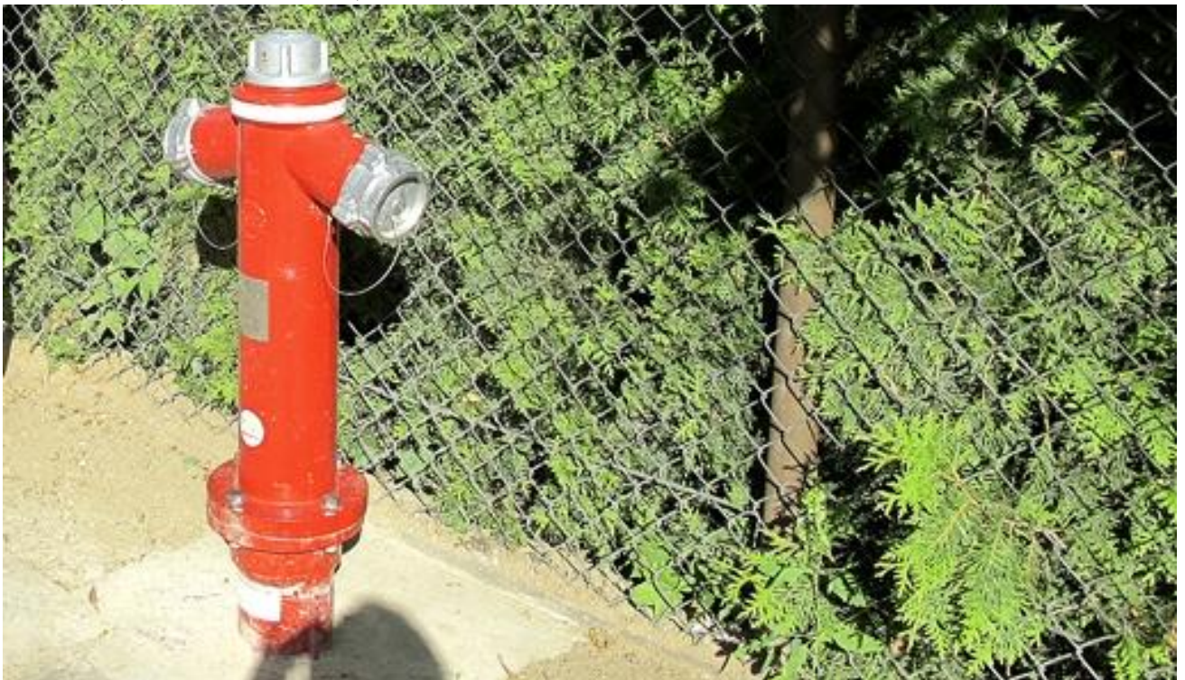
Pav. 3. Prie istorinių medinių pastatų derantis antžeminis raudonas vandens hidrantas