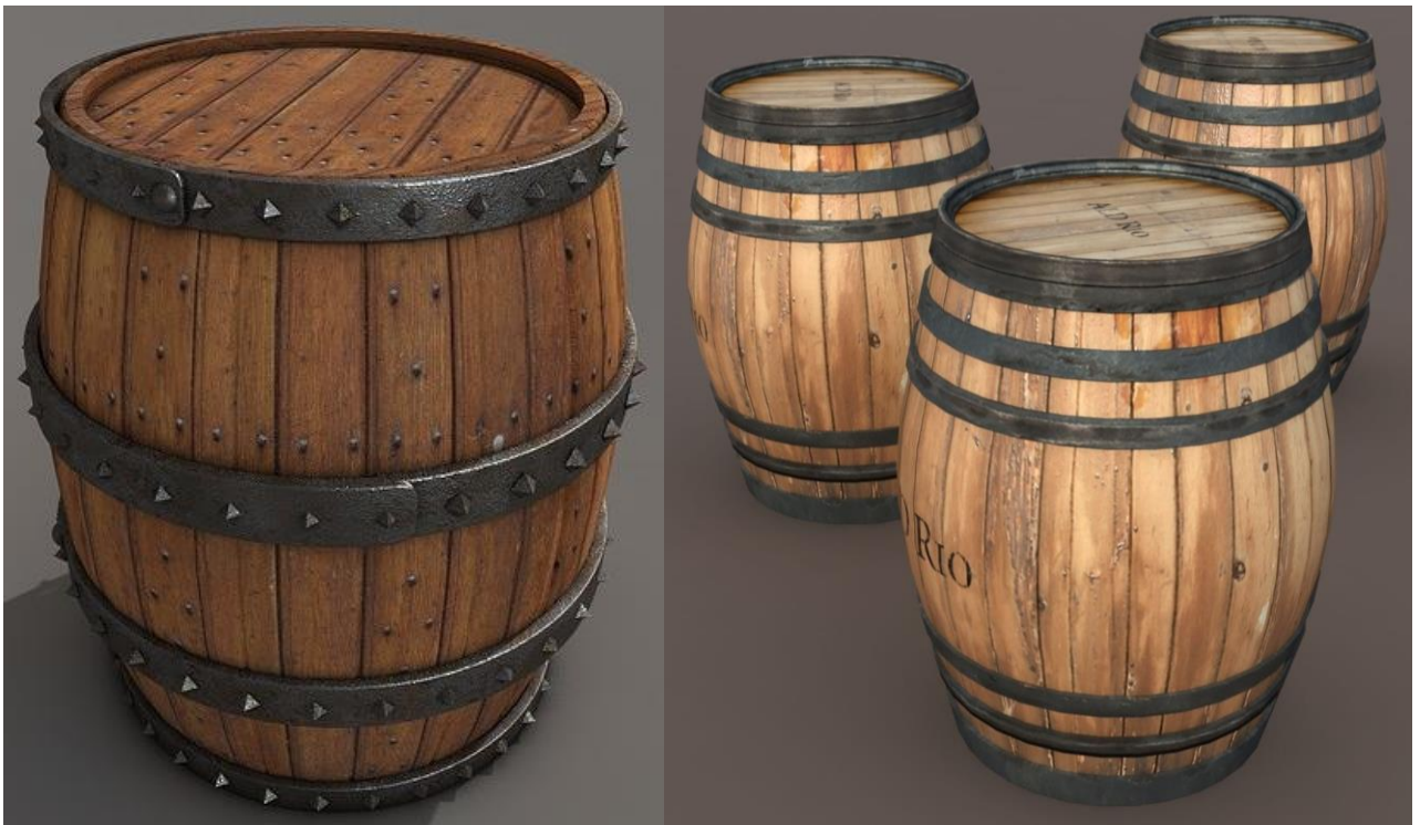
Pav. 4. Medinė statinė